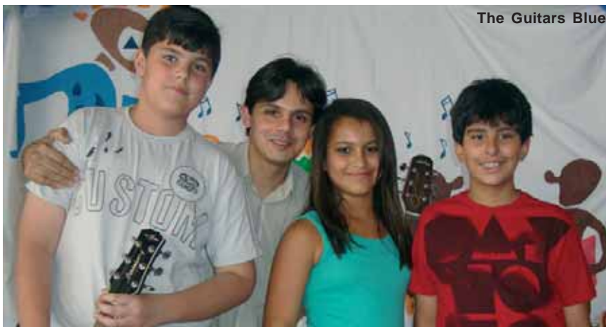
The Guitars Blues